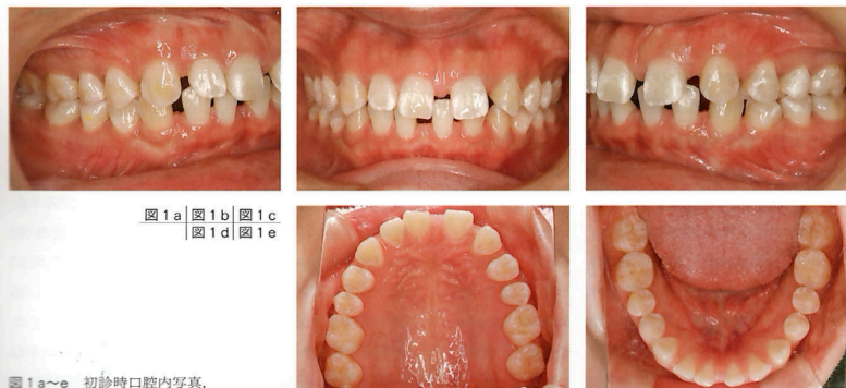
図1a～e 初診時口腔内写真。